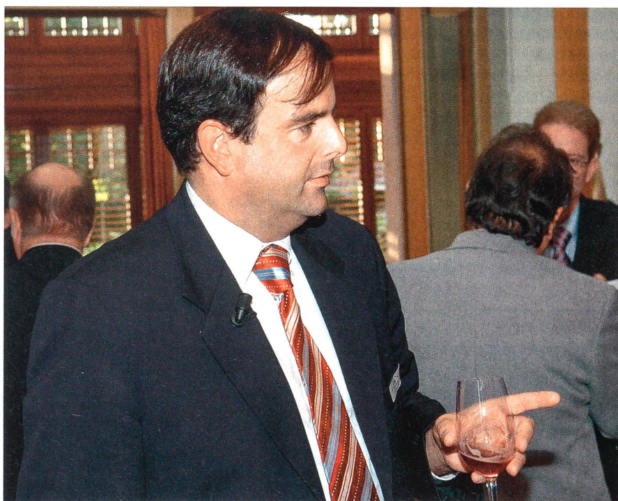
Nationalrat Gerhard Pfister: «Political correctness bedroht die Freiheit.»

Die Gründungsgeschichte der Vereinigten Staaten zeigt eindrücklich, wie man einen Staat aufbaut, der auf dem Natur-