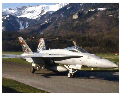
Der unverwüsthliche F/A-18 Hornet.