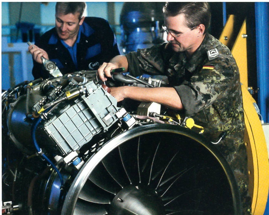
Von der Kooperation mit der deutschen Luftwaffe profitiert auch die Rüstungsindustrie.

Grössenordnung von 250 000 Soldatinnen und Soldaten an den Rand ihrer personellen und materiellen Leistungsfähigkeit bringt?