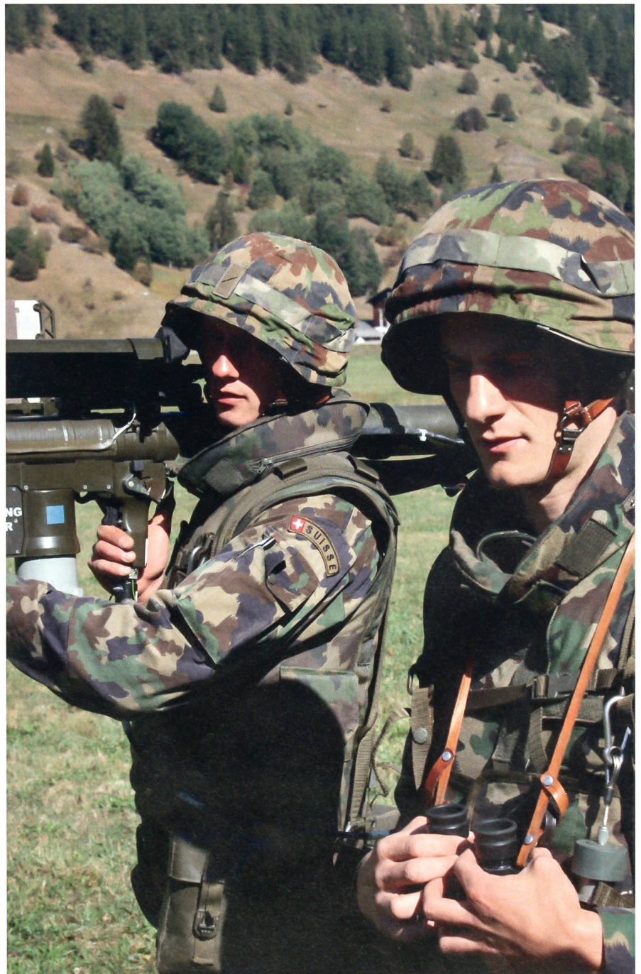
Moderne Ausbildung an der Fliegerabwehrenkwaffe Stinger im Obergoms.

Für jeden dieser Typen von Modulbausteinen (z.B. Br Stab, Inf Bat, Pz Bat oder Log Bat) sind die Vorgaben individuell de-