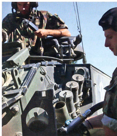
Die Armee muss stark gerüstet sein.

Pro Militia fordert Parlament, Bundesrat und Parteien auf, die Vorgaben der Bundesverfassung einzuhalten.