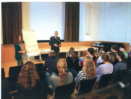
Oberst Martin Michel diskutiert die von den Mittelschülern vorgetragenen Bedrohungen.

grundsätzliche Ablehnung gegenüber der Armee besteht. Man erkennt sowohl Sinn als auch Notwendigkeit der Armee im sicherheitspolitischen Ganzen. Die Kosten der Armee werden zwar als hoch eingestuft, aber für die Aufrechterhaltung der Sicherheit als gerechtfertigt empfunden.