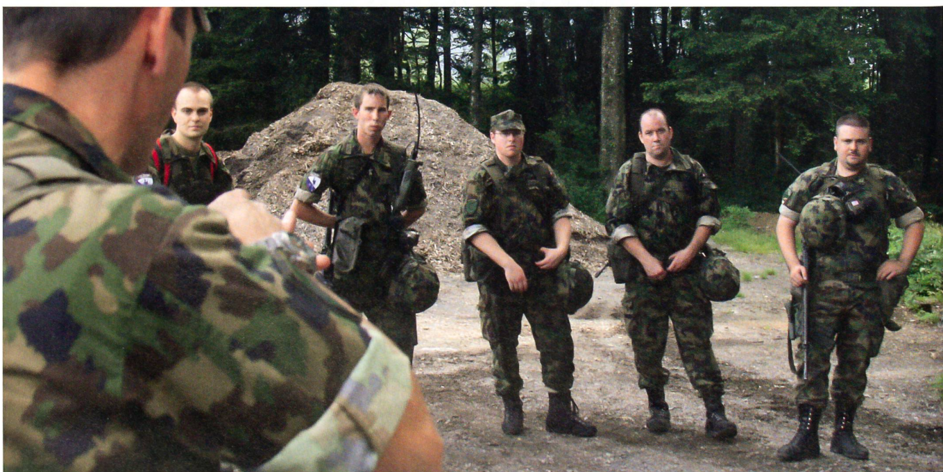
Mit den Ausbildungsmodulen SYNCHRO wird ein Gleichstand der Ausbildung innerhalb des SUOV angestrebt.