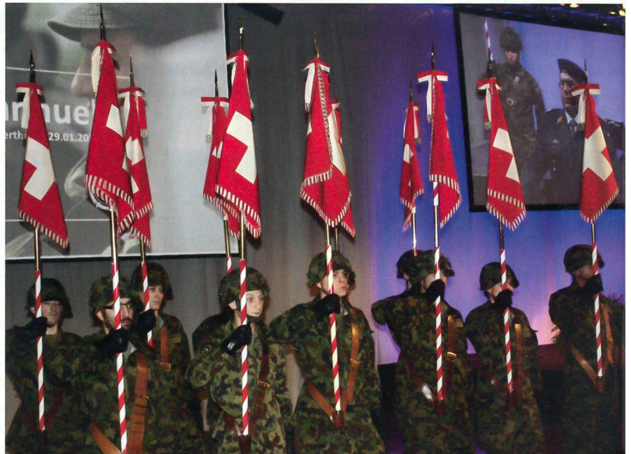
Ein seltenes Bild: Elf der insgesamt 21 Bataillonsfähnriche nach dem Einmarsch.

In der Logistikbasis der Armee habe man indessen viel zu rasch viel zu viel Personal abgebaut: «Dieser Personalabbau ist jetzt gestoppt.» Es sei wie beim Skispringen im schlechten Wetter: «Nebel umhüllt die Schanze, und der Seitenwind bläst viel zu