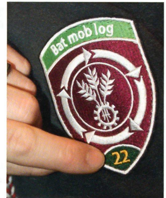
Mit Stolz zeigt der Kdt Mob Ns Kp 22/1 auf das grüne Eck, das die erste Kp bezeichnet.

wird wohl erst 2011 definitiv verabschiedet werden. Als Militär erwarte ich, dass sich die Politik auf eine gemeinsame Ausrichtung einigt. Und ich will wissen: