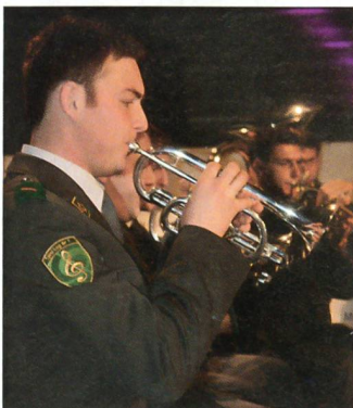
Schwungvoll umrahmte das Spiel der Logistikbrigade den straff organisierten Rapport.

Kritisch setzte sich Stoller mit der eigenössischen Politik auseinander: «Dem Sicherheitspolitischen Bericht widerfuhr im Bundesrat eine Verzögerung. Der Bericht