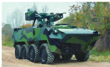
Radschützenpanzer Pandur mit fernbedienter Waffenstation.

In Tschechien befindet sich der Kauf von rund 240 Radschützenpanzern des Typs Pandur immer noch in der Schwebe. Nachdem der Auftrag über 1-1,4 Milliarden US-Dollar zuerst wegen technischer Probleme bei der Integration verschiedener Systeme und im Anschluss wegen Bestechungsgerüchten auf der Kippe stand, wird nun eine Kürzung des Auftrages aufgrund der schweren Wirtschaftskrise, welche Tschechien getroffen hat, vermutet. Die 8x8-Fahrzeuge des Typs Pandur II sollen bei den Streitkräften die veralteten Fahrzeuge des Typs OT-