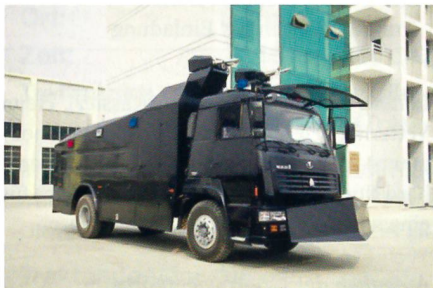
Fahrzeug des Herstellers Dalian Eagle-Sky Co. für den Ordnungsdienst.

Das Regime in Teheran hat von China neue Fahrzeuge zur Kontrolle von Aufständen und Demonstrationen gekauft. Die Fahr-