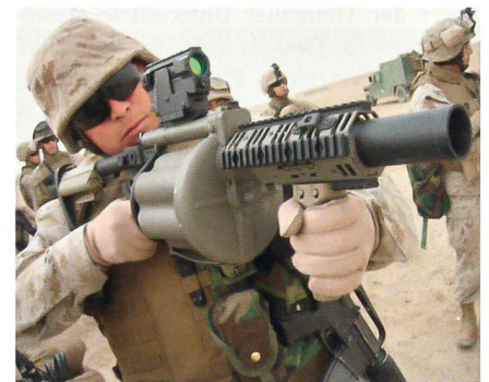
US Marine mit Granatwerfer M-32.

Der M-32-Granatwerfer der US Marines verschießt 40-mm-Granaten und verfügt über ein sechsschüssiges Magazin. Er verfügt über einen Einschubschaff, optische Zielhilfe sowie einen Vorderschaft mit Standardschienen zum Anbringen von modularem Zube-