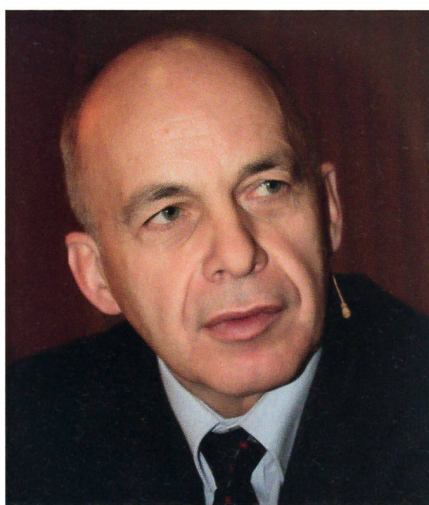
Bundesrat Ueli Maurer: «Kompromiss».

Der neue Bericht beschreibt die sicherheitspolitischen Entwicklungen der letzten zehn Jahre und analysiert das Umfeld der