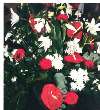
So perfekt wie die Pressebetreuung und das Essen: Der rot-weisse Blumenschmuck.

Rekruten sichergestellt werden konnte. Diesen ersten Meilenstein haben wir dank dem grossen Effort unserer Mitarbeiterinnen und Mitarbeiter geschafft.