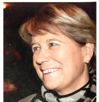
Nationalrätin Corina Eichenberger sprach zum Thema: Freiheit und Sicherheit.