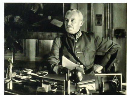
General Guisan am Schreibtisch.

Eröffnung: Donnerstag, 20. Mai, 18 Uhr. Mit Ansprache von Bundesrat Ueli Maurer, Vorsteher des Eidgenössischen Departements für Verteidigung, Sport und Bevölkerungsschutz (VBS).