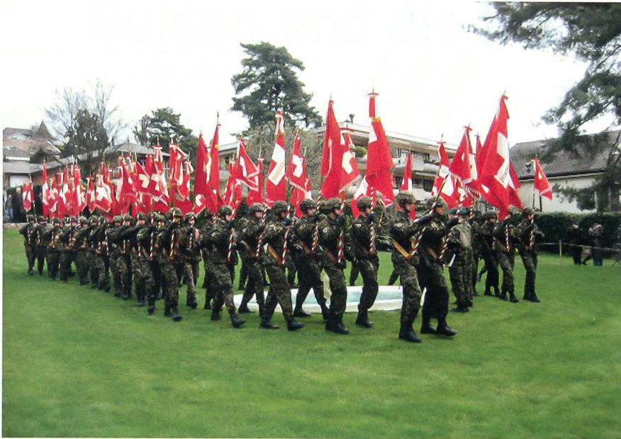
Die Feldzeichen – Fahnen und Standarten – im Anmarsch.