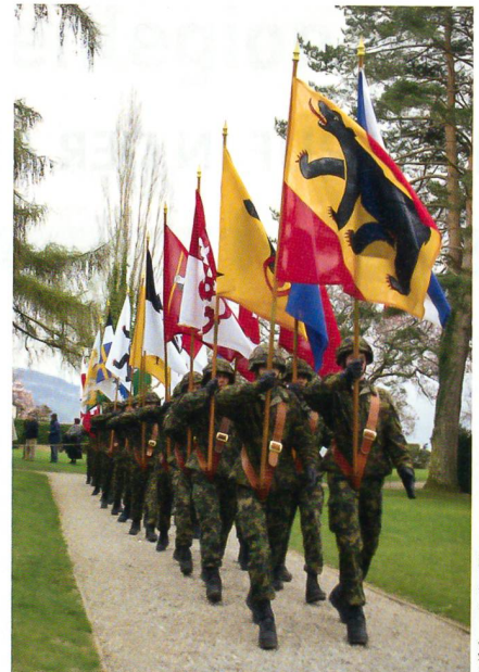
Die Fahnen der Kantone.