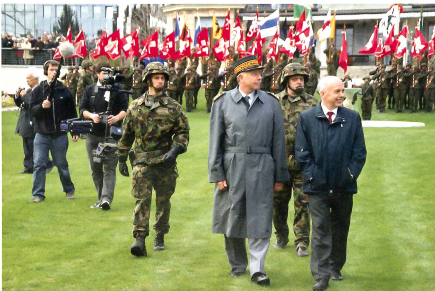
Korpskommandant André Blattmann, Chef der Armee, und Bundesrat Ueli Maurer.