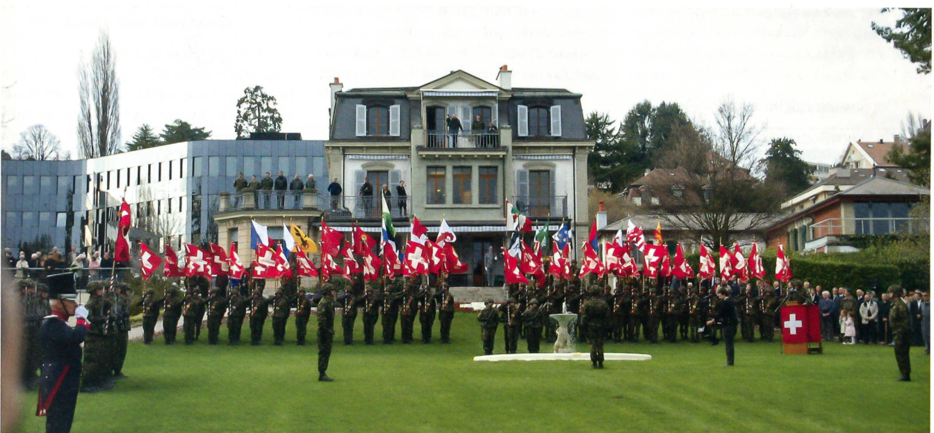
12. April 2010: Ein ergreifendes, wunderschönes Bild im Anwesen Verte-Rive von Pully.