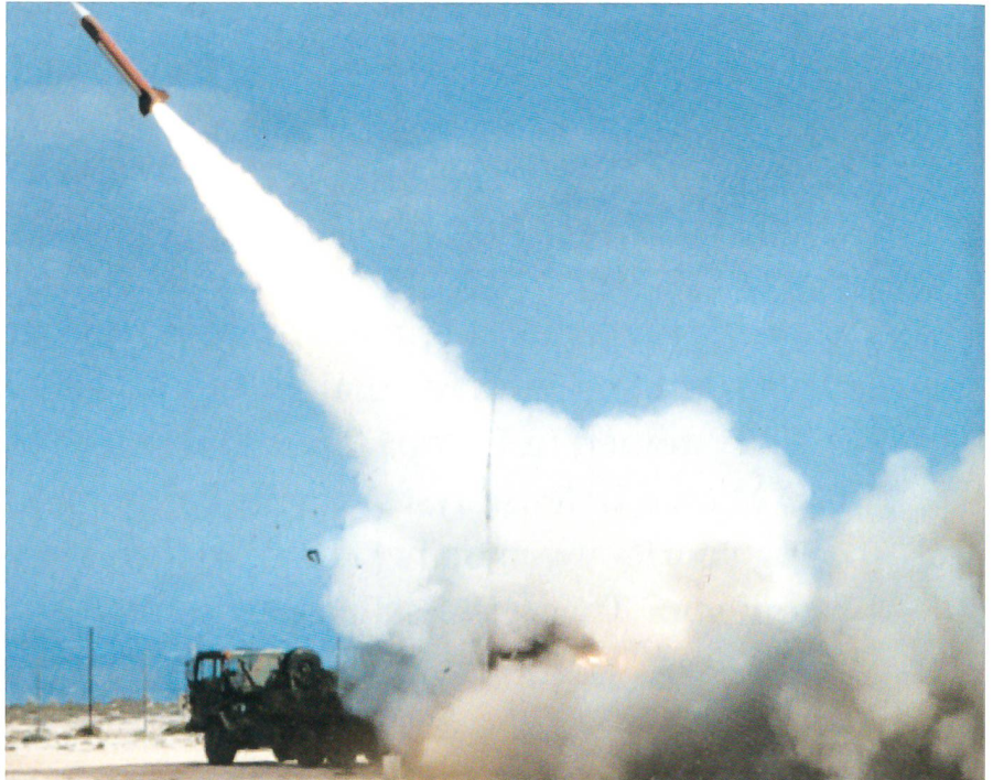
Auf dem Raketenschiessegelände NAMFI der NATO in Kreta: Von der Rampe wird mit unerhörtem Lärm eine Patriot-Rakete in Richtung Kretisches Meer abgefeuert.

Der derzeitige Präsident der USA täte gut daran, sich das Schicksal von Präsident Gorbatschow, der 1986 öffentlich die Abschaffung aller Atomwaffen auf dem Planeten auf das Jahr 2000 terminiert hatte, zu vergegenwärtigen. Henry Kissinger: «Ignored by an outside world which had so recently celebrated him, Gorbatschow wanded into the limbo reserved for statesmen shipwrecked by striving for goals above their capabilities!»