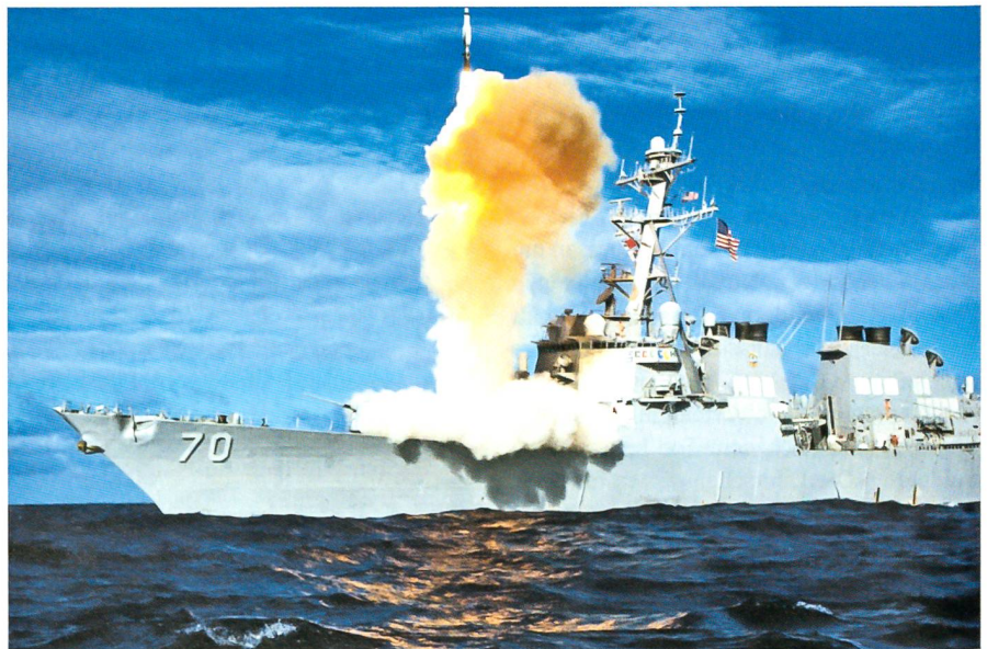
Eine seltene Aufnahme vom März 2009: Vom amerikanischen Zerstörer USS Benfold wird eine SM-3-Rakete abgefeuert.