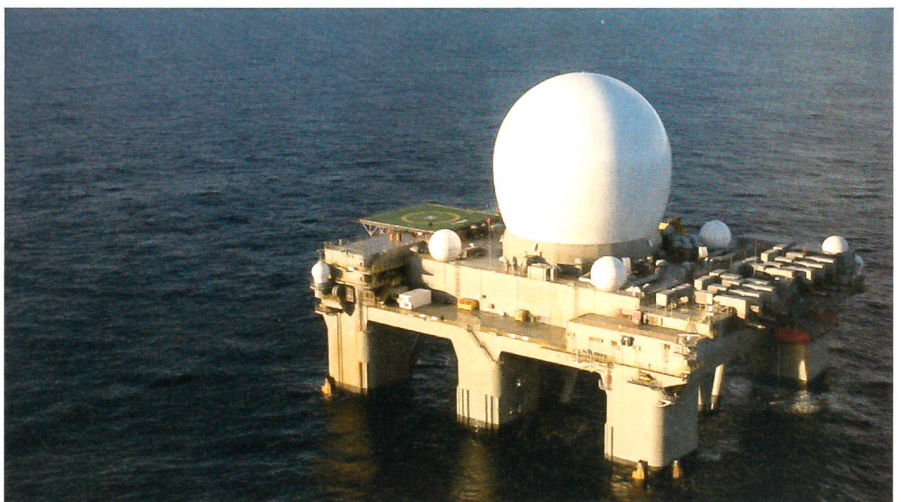
Eine amerikanische X-Band-Radarstation für ballistische Raketen.