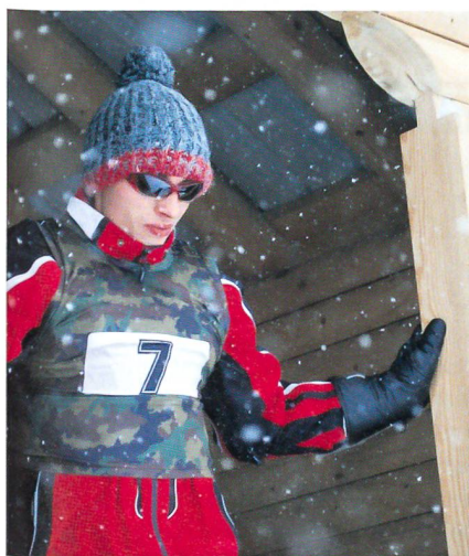
Wie bei Olympia: Volle Kraft am Start.