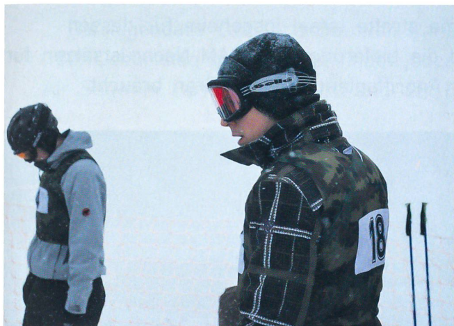
Ganze Konzentration auf das Rennen vor dem Start.