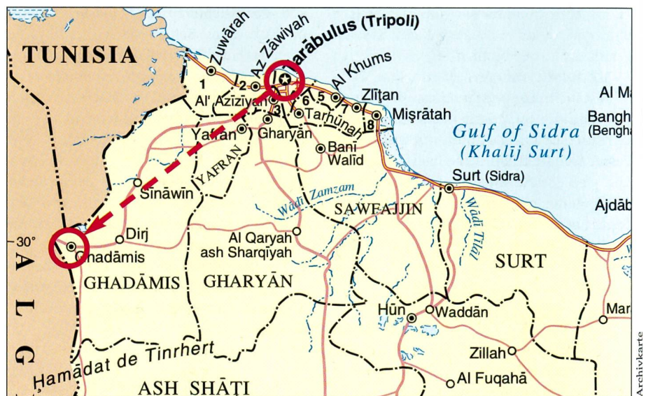
Libyen mit der Hauptstadt Tripoli (Tarabulus) und der Oase Ghadamis.

Im Hinblick auf eventuelle künftige Aktionen sind die beteiligten Instanzen sehr vorsichtig geworden. Sie wissen, dass der «Hirtenknaben»-Vorteil – die Vermutung, die Schweiz könne und wolle nicht eingreifen – dahin ist. Umso sorgsamer sind