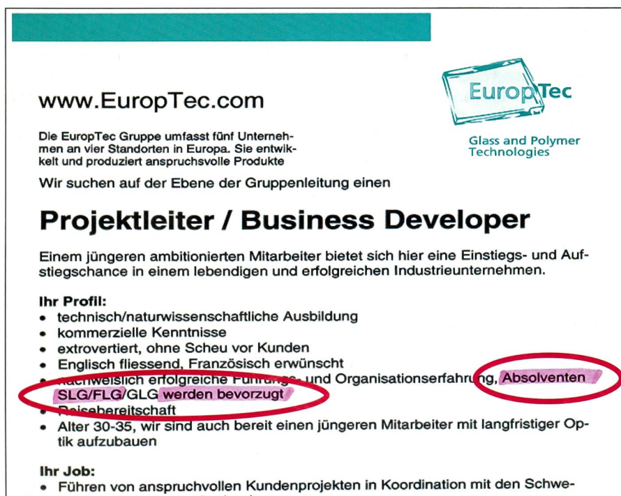
Stelleninserat der Firma Europotec mit Hinweis auf militärische Führungserfahrung.

Auf der anderen Seite begrüsst es die Privatversicherer als wirtschaftlich handelnde Unternehmen natürlich, wenn sie, wie in der Form der Führungsausbildung, konkreten Nutzen und Mehrwert aus der Armee und dem Engagement für die Miliz generieren könnten.