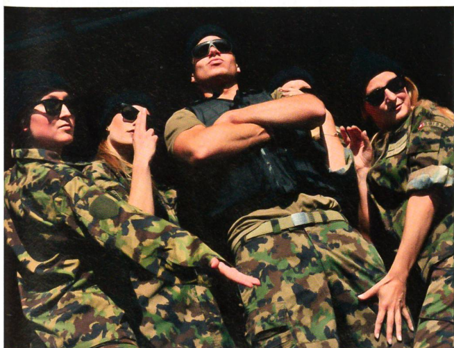
Foire du Valais: Präsentation der «VBS-Mode».