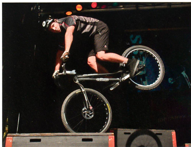
Hohe Kunst in Martigny: die gelungene Bike-Show.