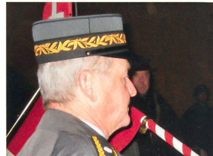
Schirmmütze: Alles rechtens.

Seit dem Tag, an dem die welschen Offiziere anlässlich der Chabloz-Verabschiedung steife Hüte trugen, treffen auf der Redak-