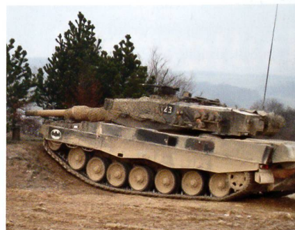
Panzerbrigade 1: «Übe, wie du kämpfst»