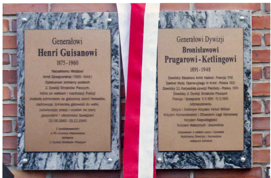
Die Gedenktafel für die Generäle Henri Guisan und Bronislaw Prugar-Ketling.