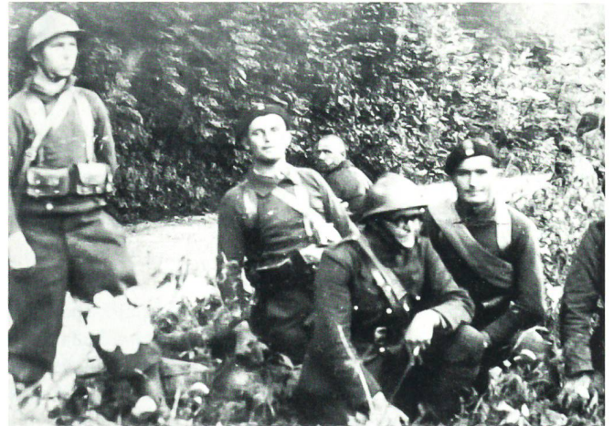
Erschöpfte polnische Soldaten nach ihrer Ankunft in der Schweiz.