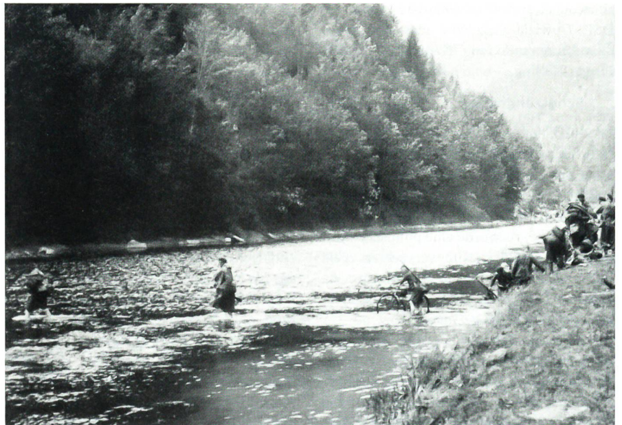
Die dramatische Flucht vor der deutschen Wehrmacht über den Doubs.

besserte sich die Situation für die Internierten.