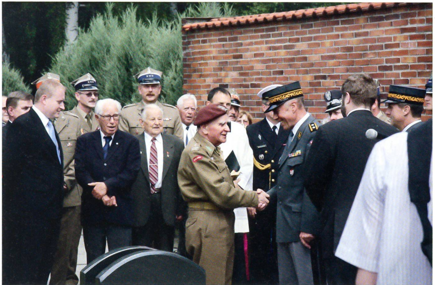
Oberst Włodimirz Cieszkowski und Divisionär Eugen Hofmeister begrüßen sich in der polnischen Hauptstadt Warschau.

Der Schweizerische Unteroffiziersverband SUOV stellte eine Fahndelelegation. Divisionär Hofmeister würdigte die grossen