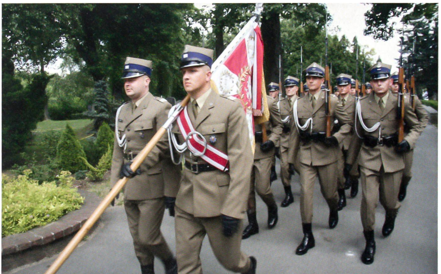
Aufmarsch der Ehrenkompanie der Garnison Warschau.