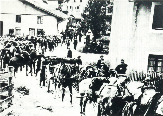
Der Grenzübertritt bei Goumois am 19./20. Juni 1940.