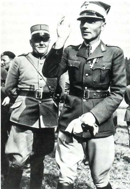
General Bronislaw Prugar-Ketling.