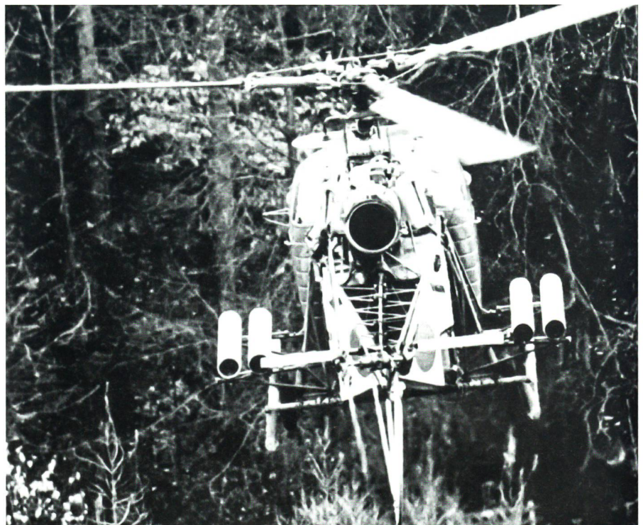
17. November 1982: Im Tiefflug sucht der «Panzerabwehr-Helikopter» über dem Thurgauer Kemmental sein Ziel. Hell erkennbar die Laser-Abschussvorrichtungen.