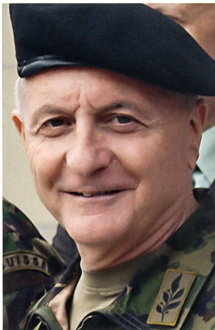
Brigadier Hans-Peter Wüthrich, ehemaliger Kdt Inf Br 7 und Kampagnenleiter gegen die Entwaffnungsinitiative: «Kriminelle werden immer Zugang zu einer Waffe haben.»

Der Präzisionsschuss hat auf dem modernen Gefechtsfeld eine immer grössere Bedeutung. Das Schiessen auf grosse Distanzen gilt es zu üben und deshalb wird das 300-m-Schiessen weiterhin eine Bedeutung haben. Eine Milizarmee ist aus Zeitgründen