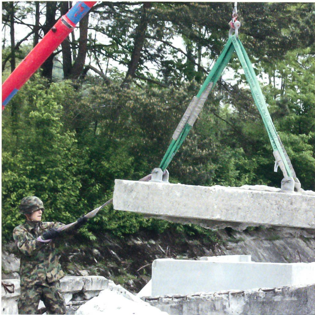
Bundesrat Maurer traf die Rettungsschule 75 mitten in der Ausbildung an: Vorsichtig wird eine tonnenschwere Last gehoben.