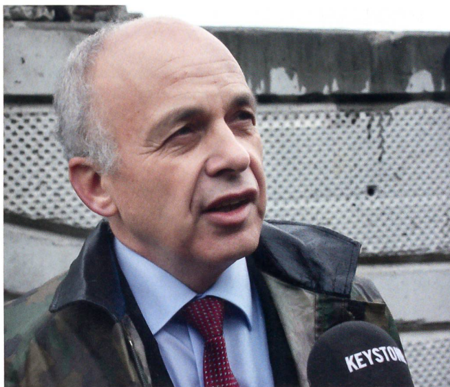
Maurer: «Jeden Monat aufs Feld – mit kurzer Vorwarnung.»