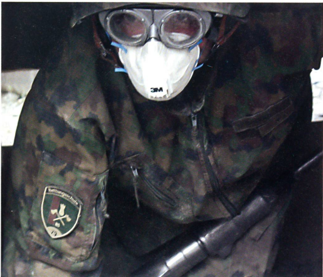
Rettungssoldaten sind Spezialisten, mitten in den Trümmern...