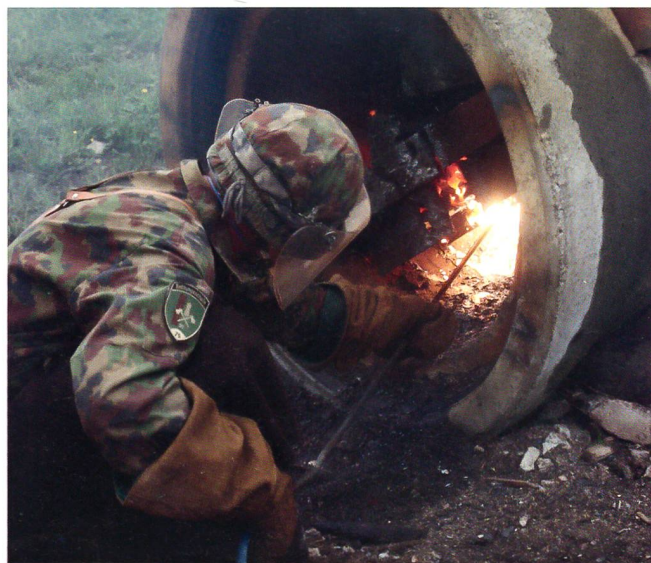
Rettungssoldat – ein anspruchsvoller Job für harte Männer.