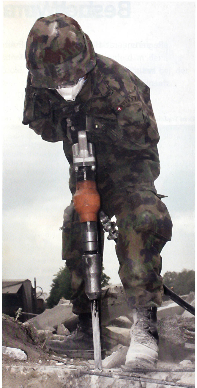
...oder auf dem zerstörten Haus mit dem Pressluftbohrer.