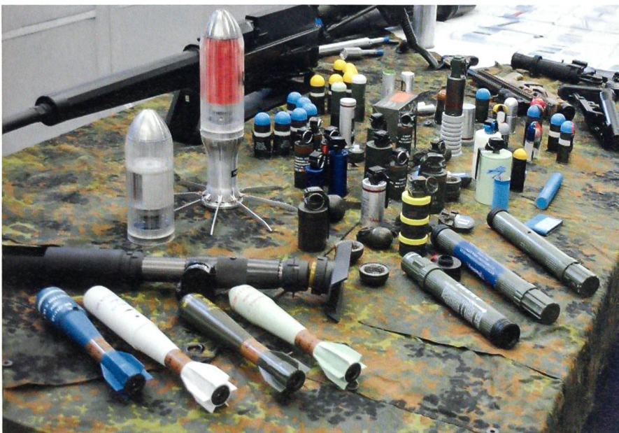
Die verschiedenen 40-mm-Granaten, -Handgranaten und -Mörsergeschosse der Firma Rheinmetall zeigen die Vielfalt der Einsatzmöglichkeiten.

Per Arvidsson machte die Anwesenden darauf aufmerksam, dass in den nächsten