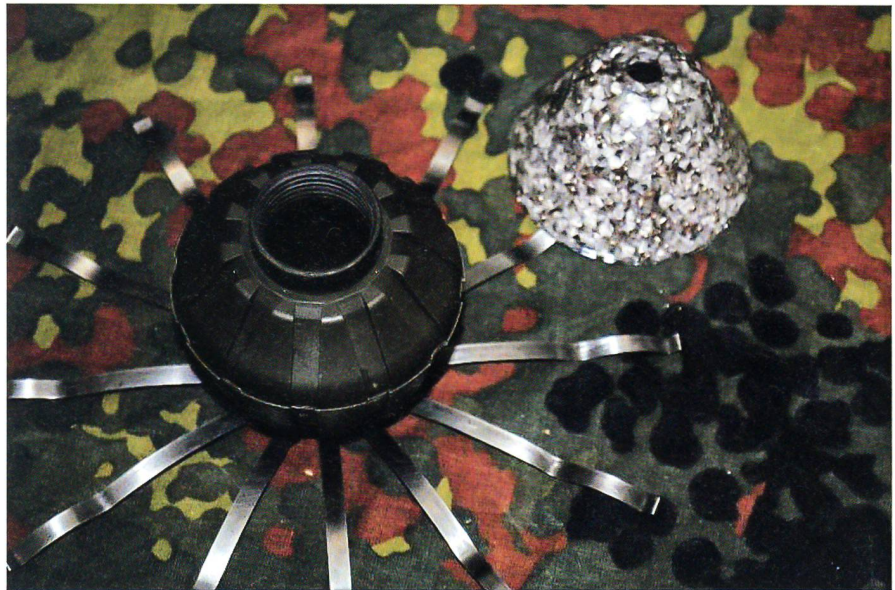
Die springende neue Handgranate mit dem ausgebauten konischen Splitterteil.

Die Splitter fliegen von oben auf das Ziel. Die üblichen Handgranaten explodieren in der Regel am Boden, wobei ein wichtiger Teil der Energie in den Boden und nicht Richtung Ziel fliegt. Mit dem neuen System kann die Wirkung verbessert werden und der Werfer wird durch die Splitter