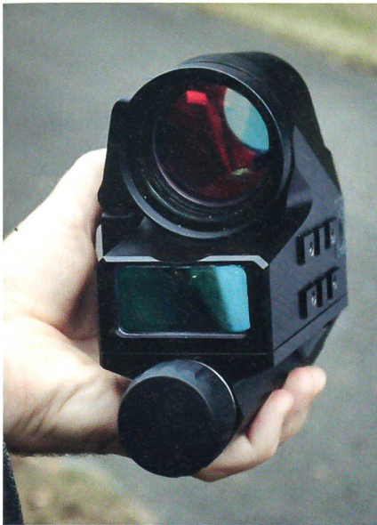
Das elektronische Zielsystem FCS12.

zehn Jahren wegen der hohen Kosten kein Wechsel auf grössere Gewehrkaliber zu erwarten sei. Hingegen sei die Industrie aufgefordert, die Munition so zu verbessern, dass auch die Durchschlagskraft im Ziel verbessert werden könne.