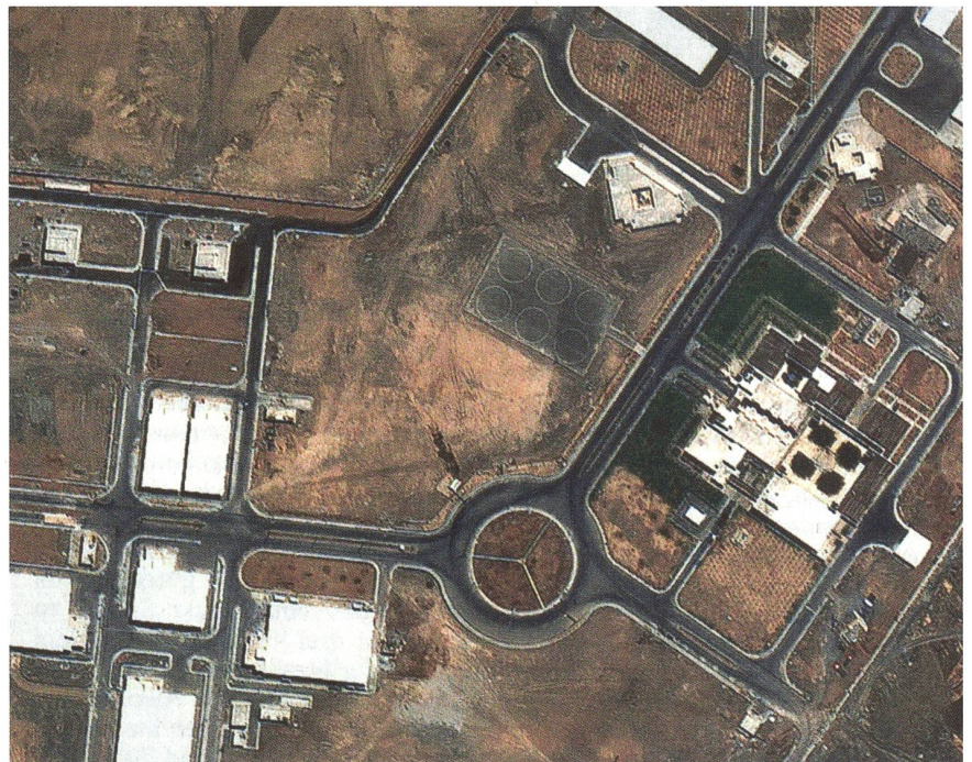
Die iranische Atomanlage bei Natans: Für den Mossad ein militärisches Ziel.