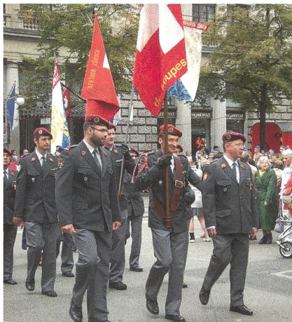
Einmarsch der Fahndelelegation in Zürich.

Bei der Stadtzürcher Bundesfeier waren gleich mehrere Vereine engagiert. Kurz vor sieben Uhr brachte der Artillerieverein Zürich sein über 100jähriges Geschütz ober-