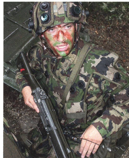
Für eine Armee, die kämpfen kann.