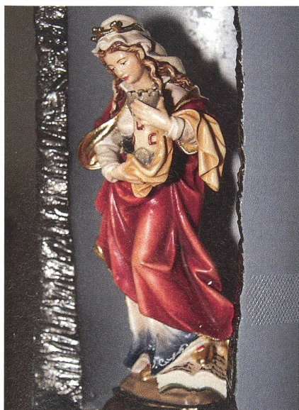
Die Schutzpatronin, die heilige Barbara.