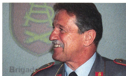
Brigadegeneral Hupka, Bundeswehr.