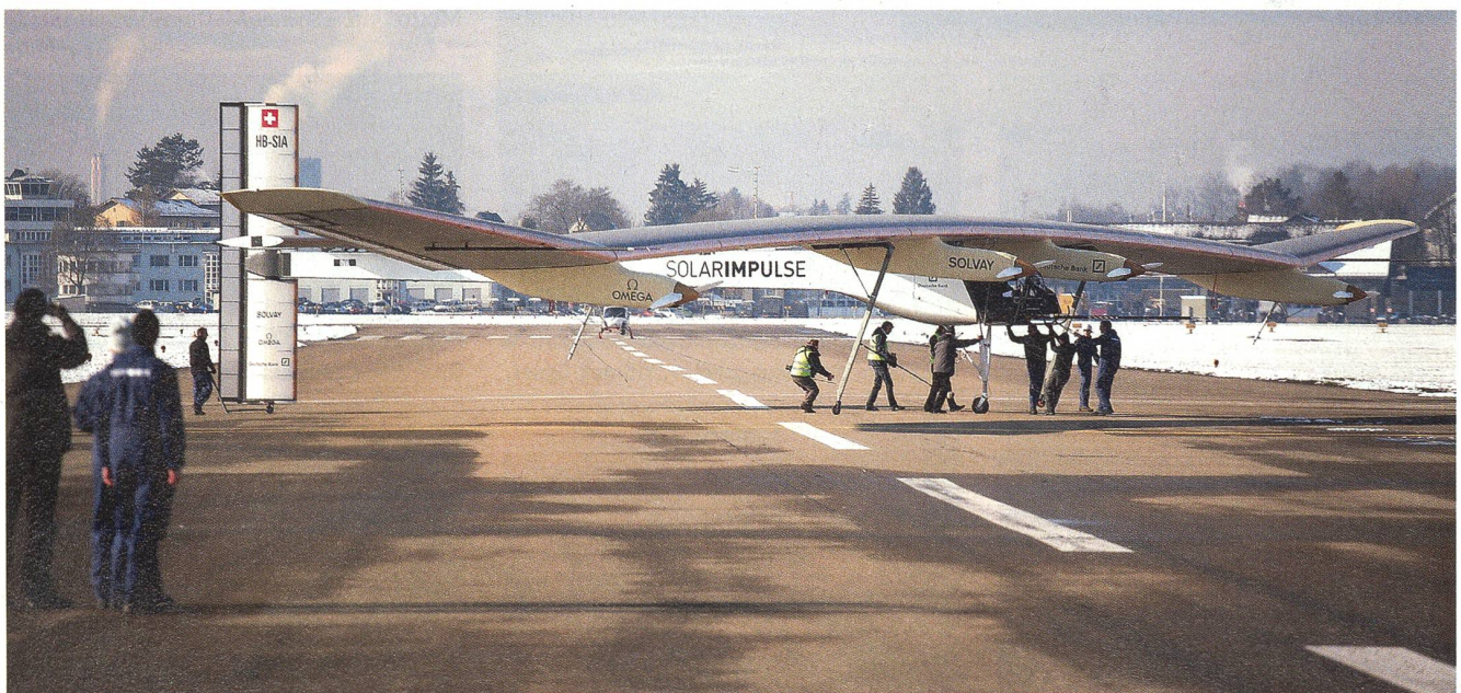
Solarimpulse auf dem Flugplatz von Dübendorf: Modernes Gerät mit imposanter Spannweite als Beispiel für moderne Nutzung.