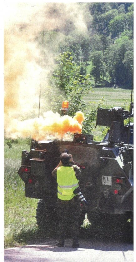
Abgeschossener Panzer in Answiesen.