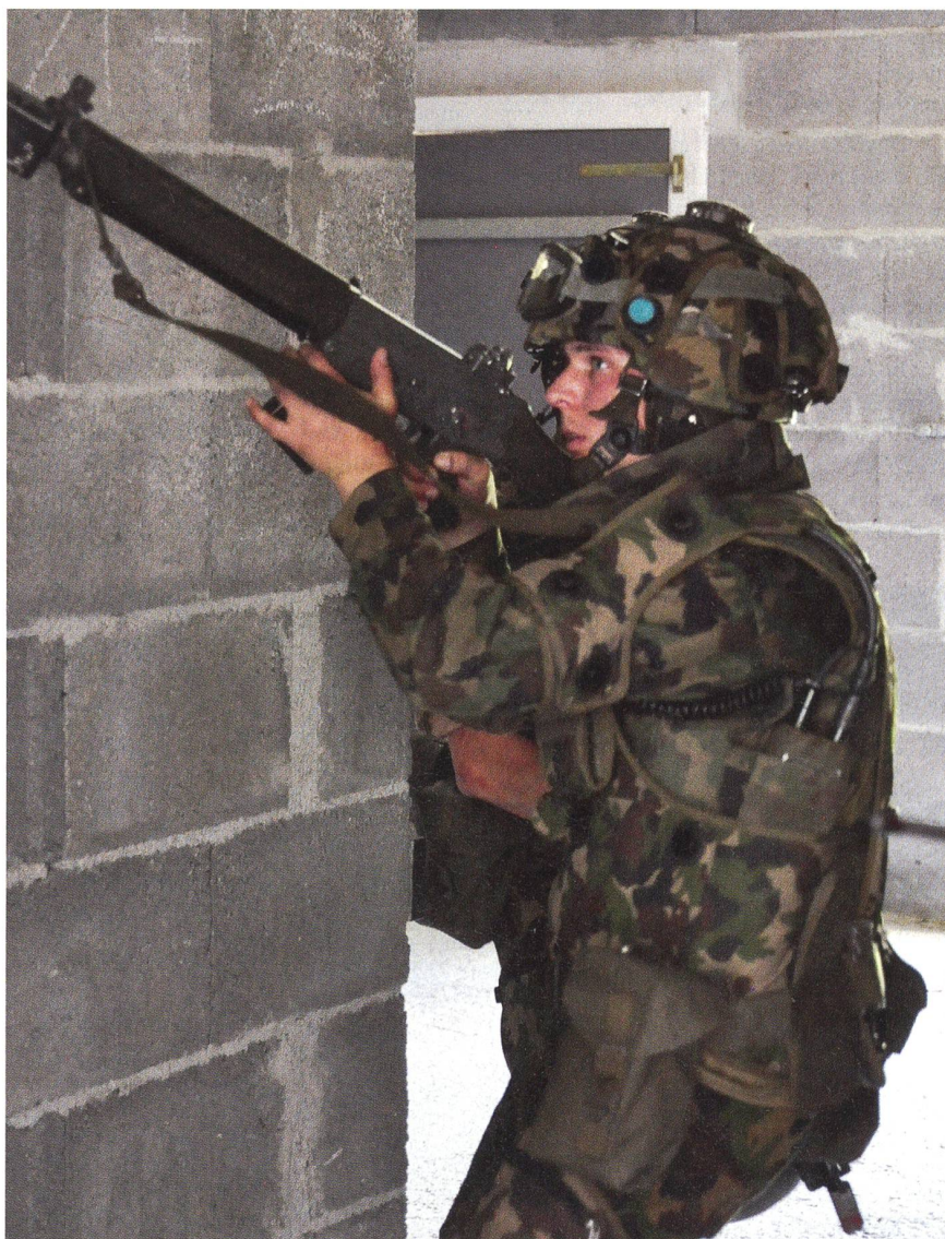
Gebäude um Gebäude muss durchsucht werden.

Entsprechend werden die Kader und Soldaten nach dem Entschluss und Hintergrund gefragt. Wichtig ist der gegenseitige Respekt und die Ehrlichkeit; nur so wird der Verband bei der nächsten Übung die gleichen Fehler nicht mehr wiederholen. Mit gezielten Fragestellungen werden auch die letzten Reserven aus dem Verband herausgeholt. Nach gut einer Stunde ist die Besprechung vorbei, und ein weiterer intensiver Tag im Inf Bat 97 neigt sich dem Ende zu. +