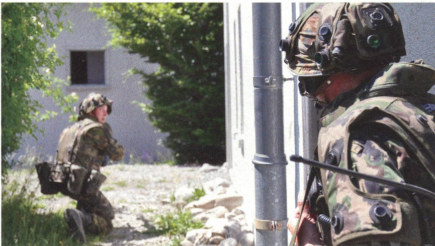
Kommunikation – im Ortskampf das A und das O.