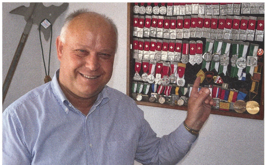
Der ehemalige Schützenpräsident vor dem Abzeichenkasten.