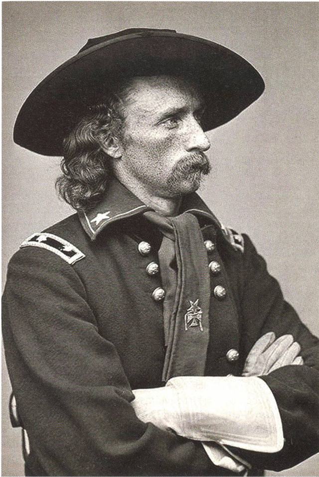
General George Armstrong Custer 1839–1876.