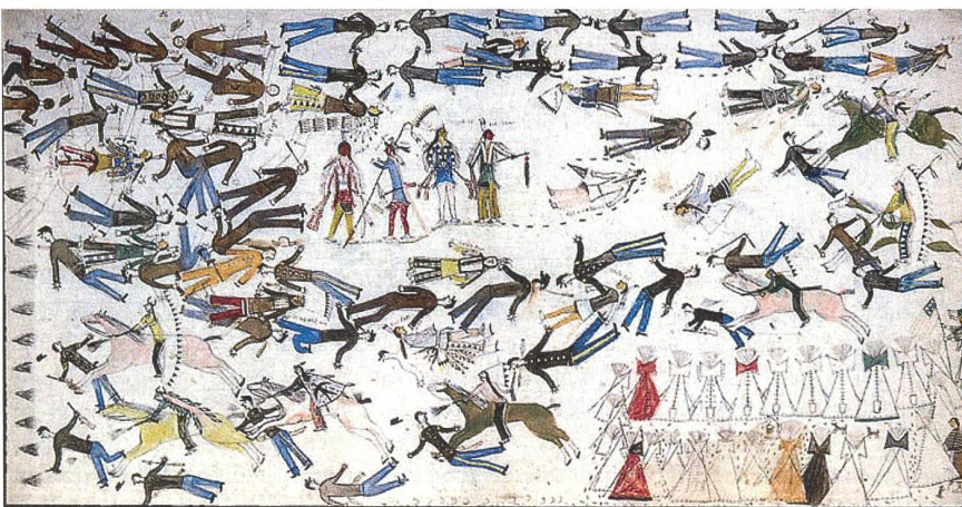
Indianische Darstellung der Schlacht am Little Bighorn vom 25. Juni 1876.

Sitting Bull gelang es, die feindlichen Reservekräfte, die unter dem Befehl von Major Marcus A. Reno standen, derart unter einem Dauerbeschuss am Fluss erfolgreich zu binden, dass seine berittenen Krieger in einer langgezogenen dünnen Linie die Flucht vortäuschten konnten, als Custer