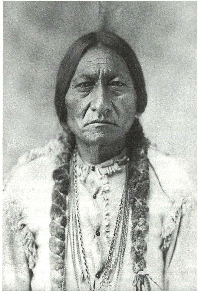
Medizinmann und Häuptling der Sioux, Sitting Bull 1831–1890.