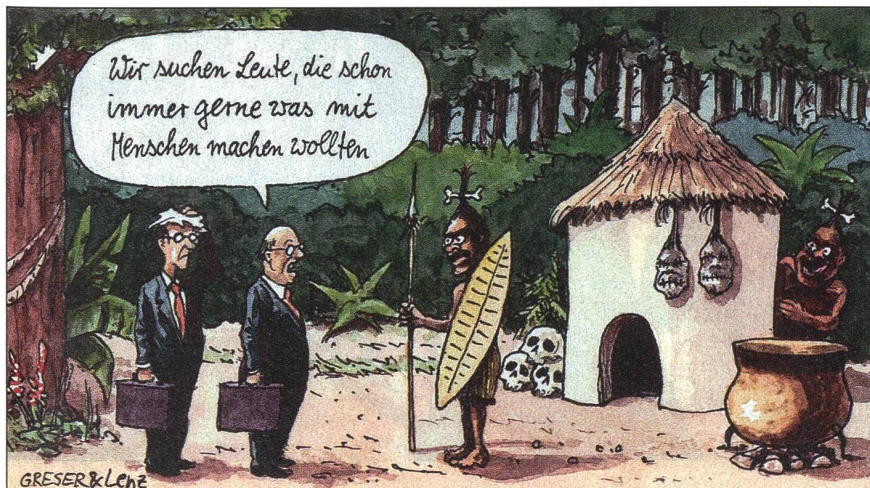
Europa wirbt in aller Welt um Fachkräfte.

Ursula Bonetti: Tag der Unteroffiziere in Sion