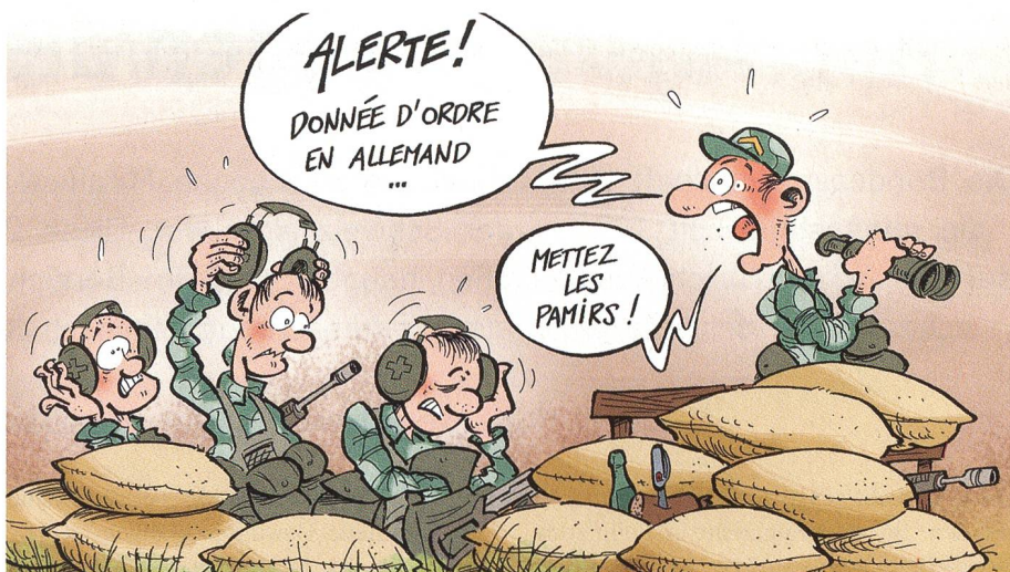
«Alarm. Befehlsgebung in deutscher Sprache. Setzt den Pamir auf!».

Die Hauptunterschiede zwischen der Privatwirtschaft und einer Institution sind zudem, dass die Privatwirtschaft keine Ar-