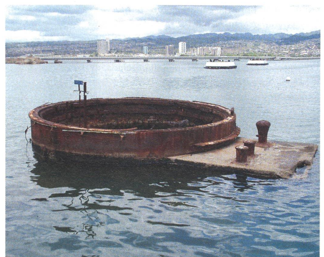
Die Überreste eines Geschützturms der USS «Arizona» ragen noch immer aus dem Wasser. Die sterblichen Überreste der 1177 Seeleute sind an Bord geblieben.