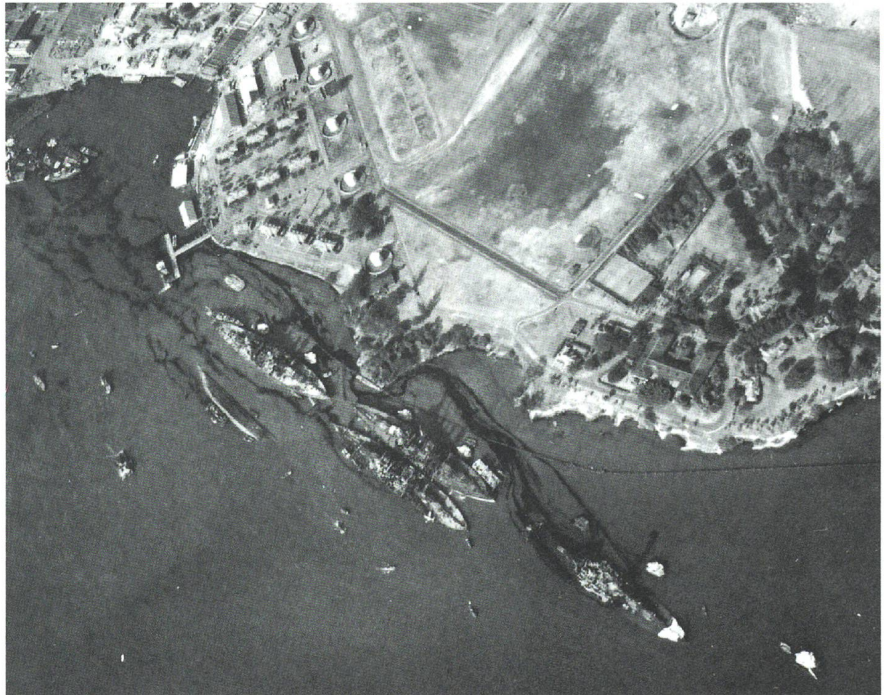
Luftaufnahme kurz vor dem Angriff der japanischen Marine auf Pearl Harbor mit der Battleship Row, unten rechts die USS «Nevada» (BB-36), daneben im Zweierpaket die USS «Arizona» (BB-39), näher beim Ufer gelegen.

Am 2. November 1941 soll die japanische Regierung und das Imperiale Generalhauptquartier – wohl mit dem Segen des Kaisers – den Entscheid für einen Krieg gegen die USA und Grossbritannien gefällt haben. Admiral Yamamoto wies daraufhin