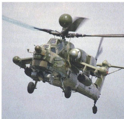
Unterlegener russischer Kampfhelikopter des Typs Mi-28 Night Hunter.

Bei der Ausschreibung nach einem neuen Kampfhelikopter hat sich der amerikanische AH-64 Apache gegen den russischen