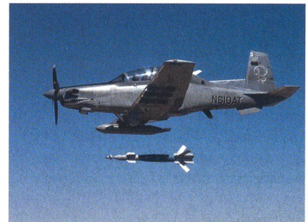
Abwurf einer lasergelenkten Bombe von einem AT-6.

Hawker Beechcraft Defense Company (HBDC) hat bekannt gegeben, dass sie eine Reihe von Abwürfen von präzisions-