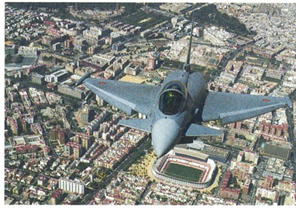
Spanischer Eurofighter über Sevilla.

Die spanische Luftwaffe hat die 300. Maschine des von den vier Partnerunternehmen des europäischen Konsortiums gefer-