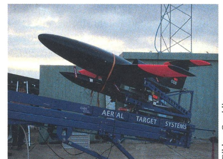
Und das ist Cassidians Geschoss 088.