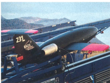
Gut erkennbar der Drohnen-Antrieb.