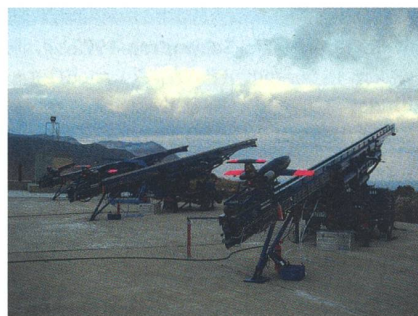
Drei geladene Rampen nebeneinander.