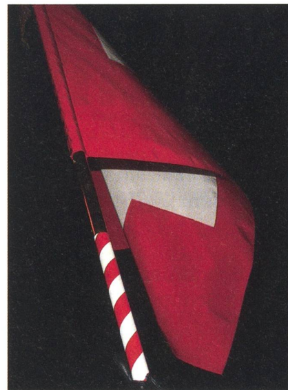
Über dem Rheinfallfelsen weht die Schweizerfahne, das Zeichen der Armee als Schicksalsgemeinschaft.

Die Politiker unseres Landes, insbesondere der Nationalrat, der Ständerat und der Bundesrat, sind aufgefordert, zu definieren, wie die Sicherheit für unser Land und unsere Bevölkerung in Zukunft