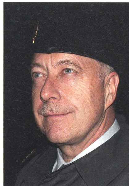
Ein unvergesslicher Moment: Korpskommandant André Blattmann, der Chef der Schweizer Armee, aufrecht auf dem festen Rheinfallfelsen mitten in der Brandung.