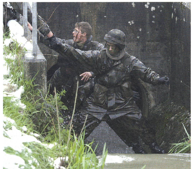
Stress gegen Ende einer zehntägigen Durchhalteübung. Letzte Kräfte werden freigesetzt.