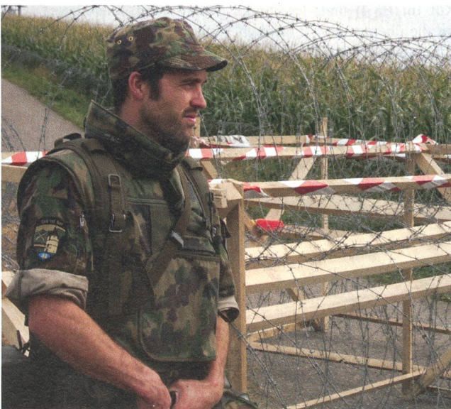
Einsatz in ungewohnter Umgebung: Ein Gebirgsinfanterist am Flughafen Kloten.

Sowohl das Lernmodul wie auch die Selbstkontrolle wurden durch das ZEM produziert. Dieses bildet die zentrale Medienproduktionsstelle des Departementsbereichs Verteidigung für Produkte und Dienstleistungen im Bereich der Ausbildung und Kommunikation. Es verfügt über Fachspezialisten aus den Bereichen Audiovisuelle Medien, Interaktive Medien, Foto, Printmedien, Mediathek und Produktionsunterstützung. Diese arbeiten je nach Auftrag stark vernetzt zusammen, so auch bei den Modulen, die für die Geschäftsstelle KSD erstellt worden sind.