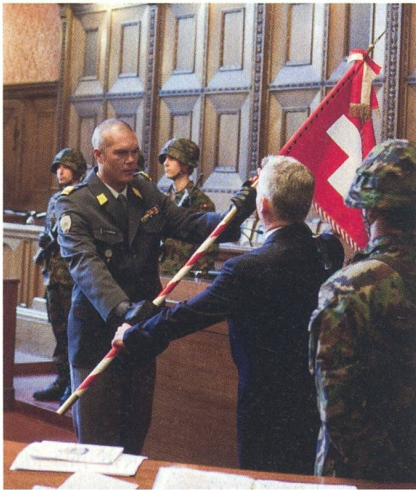
Basel: Das Ende des Panzerbataillons 25.