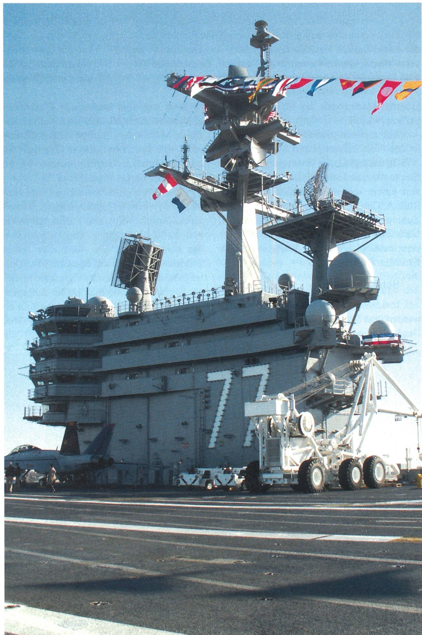
Der im Januar 2009 in Dienst gestellte Atomflugzeugträger USS George H.W. Bush (CVN 77) in Norfolk. Die erste Reisegruppe hatte das Privileg, den neuesten Flugzeugträger der U.S. Navy während zwei Stunden zu besichtigen.

Dort hatte im Bürgerkrieg 1862 ein wichtiges Seegefecht zwischen Einheiten der Konföderierten (CSS Virginia bzw. Merrimac) und der Union (USS Monitor) stattgefunden. 1907 war die Region Ort der Jamestown Exhibition, einer Art «Weltausstellung». Danach entdeckte die Regierung den Wert dieses geschützten Landstriches und erbaute in der Folge einen Marinestützpunkt. Dies waren Anfänge der heute