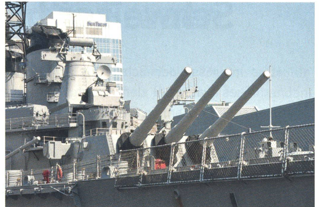
In Downtown Norfolk liegt die mächtige USS Wisconsin (BB 64) vertäut. Das Schlachtschiff wurde im 2. Weltkrieg gebaut, diente dann im Koreakrieg, wurde in der Ära Reagan modernisiert und stand auch im ersten Golfkrieg im Einsatz.

grössten Marinebasis der USA, der Naval Station Norfolk.