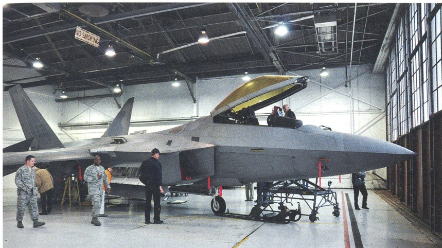
Auf der Langley AFB wurde der GMS-Reisegruppe auch das neueste Kampfflugzeug der U.S. Air Force, die F-22 Raptor, gezeigt. Diese Maschine der fünften Generation gehört zum 1. Tactical Wing.

dient aber auch den Transportmaschinen des Air Mobility Commands der Luftwaffe für Fracht- und Personentransporte in alle Welt. In der Grossregion liegt ferner der Marineluftstützpunkt NAS Oceana mit über 300 F/A-18 Hornet und Super Hornet.