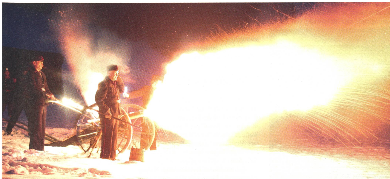
«Zu Ehren der heiligen Barbara, der Schutzpatronin der Artilleristen: Ein Schuss, Feuer frei!»