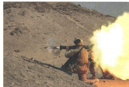
Abschuss einer AT4 Panzerfaust.

Die mit 84 mm kleinkalibrige AT4 vermag zwar die Panzerung moderner Kampfpanzer nicht zu durchdringen, ist jedoch