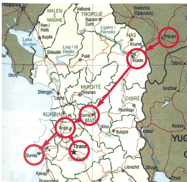
Albanien: Verschleppungsweg gemäss den UCK-Gegnern.

Was Dick Marty angeht, so hat er sich mit dem Organhandel-Vorwurf an Thacis Adresse weit aus dem Fenster gelehnt. Wenn er seinen – wie gesagt – ungeheuerlichen Vorwurf nicht beweisen kann, steht er im Regen. Allerdings ist er rechtlich gut geschützt: Als Europa-Parlamentarier genießt er Immunität. fo. CH