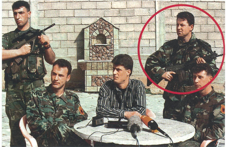
Dieses Bild, veröffentlicht vom SCHWEIZER SOLDAT im Juni 2008, machte Furore: Der Leibwächter rechts oben hatte in der Schweiz die Grenadier-RS absolviert und trug ein Schweizer Sturmgewehr. Nationalrat Bortoluzzi reichte im Parlament eine Anfrage ein. Der Bundesrat antwortete ausweichend: Das Sturmgewehr 90 sei auch auf dem freien Markt erhältlich, und der Tragriemen stamme nicht aus der Armee.

und Händlerringe grosse Mengen Heroin in die westeuropäischen Abnehmerländer.