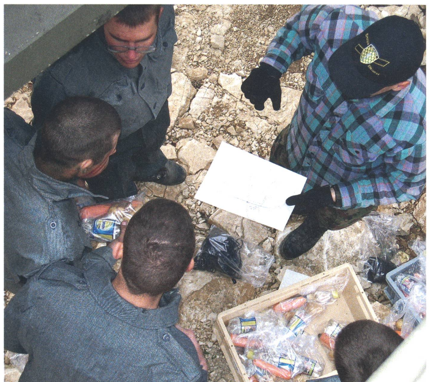
Das Bild aus der Folge-OS zeigt das Tenue, das die Aspiranten in der Phase «CAPTIVUS» trugen. Der Mann im karierten Hemd ist ein Klassenlehrer, der Befehle gibt.

Ein Rekrut nahm die läppische Szene auf und spielte sie dem Boulevard zu. Dieser fabrizierte dann Tage lang die Ketten-Story, in der Rekruten übel zugerichtet wurden. Nichts entsprach der Wahrheit, die dann zutage trat – und ausführlich veröf-