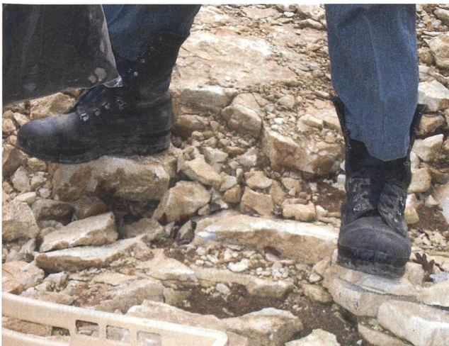
Ein Detail aus der Folge-Übung «FUGITIVUS»: Die Aspiranten trugen keine Schuhbündel, was für die Lage realistisch war.