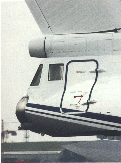
Heckkanzel vorgesehen für Bordkanone.