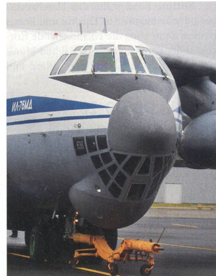
Die markante Bugnase der Ilyuschin 76.