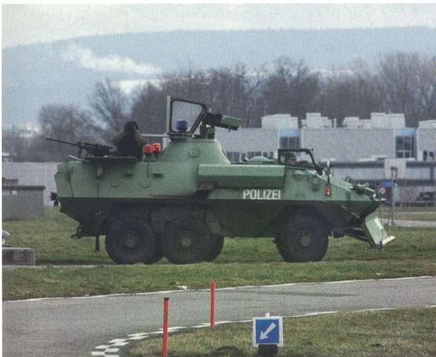
Ein Scharfschütze der Polizei überwacht das Gelände.