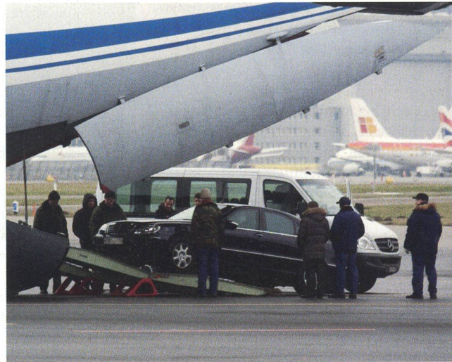
Ein russisches Regierungsfahrzeug wird in die IL 76 verladen.