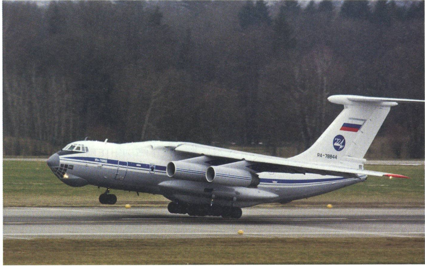
Die Ilyuschin 76 hebt Richtung Moskau ab.