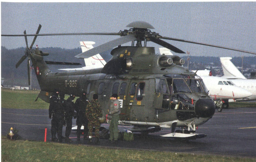
Einsatzbereit: Sondereinheit der Polizei und die Besatzung des Superpumas T-325.