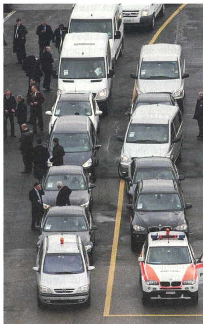
Warten auf einen hohen WEF-Gast: Konvoi mit Sicherheitspersonal, Diplomaten und einer Polizeieskorte.

Wenige Minuten nach der Landung wird die Gangway zum Flugzeug geschoben, der Präsident verlässt die Maschine. Medwedew wird durch sein eigenes Sicherheitspersonal, aber auch durch die Flughafenpolizei geschützt und abgeschirmt. Die Superpumas heben kurz darauf ab. Etwas später kann beobachtet werden, wie ein ganzer Fahrzeug-