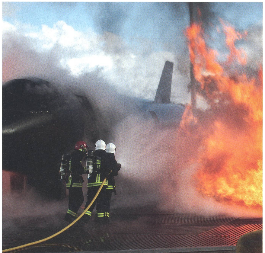
Wo ist das Flugzeug? Im Flammenmeer gilt die Hauptaufmerksamkeit dem Rumpf.

«Die Leute sollen sehen, dass sie sich auf ihre Ausrüstung – Brandschutzbekleidung, Atemschutzgerät, und was sie sonst