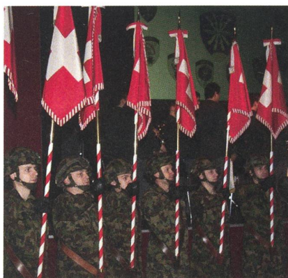
Fahnen und Standarten.