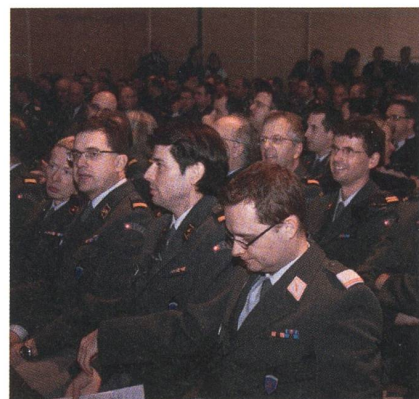
Die versammelten Kader.