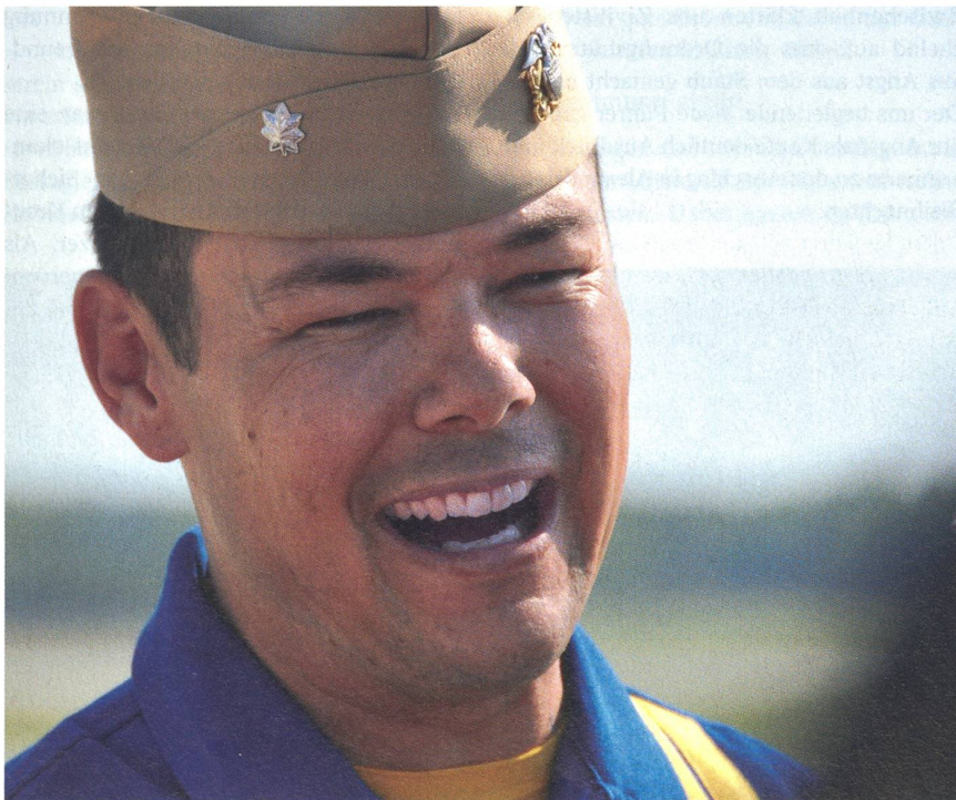
Fregattenkapitän (Commander) Greg McWherter ist Kommandant der Blue Angels. Er fliegt die Position 1. McWherter ist ein erfahrener Flugzeugträgerpilot, der über 5000 Flugstunden aufweist. Commander entspricht dem Oberstleutnant.

Letztere starteten und landeten in einer waghalsigen Einlage eine Piper Cup vom bzw. auf einem Gestell eines über die Piste rasenden Pick-up-Fahrzeuges. Rauch, Detonationen und viel Action gab es schliesslich, als ein Schwarm von Propellermaschinen mit japanischen Markierungen unter der Bezeichnung «Tora, Tora, Tora» den Angriff auf Pearl Harbor vom 7. Dezember 1941 filmreif nachstellte.