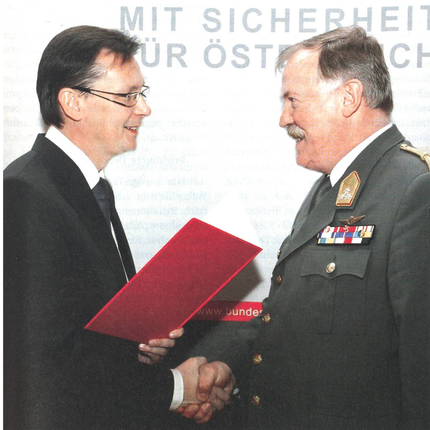
Da waren sie noch einig: Verteidigungsminister Darabos und General Entacher.