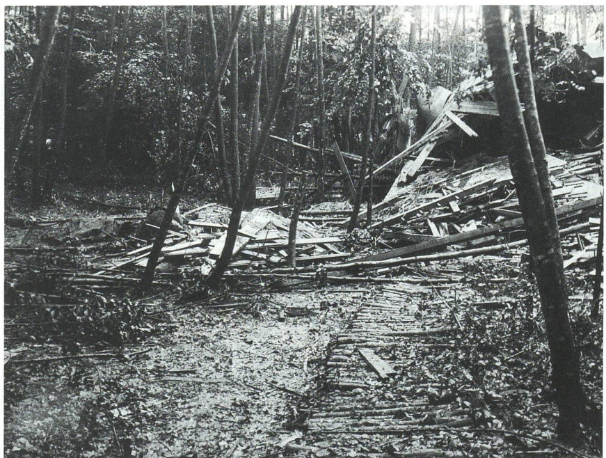
Aufnahme von der Unfallstelle in westlicher Richtung.

Nach Würdigung aller vorliegenden Punkte und vor allem der Tatsache, dass eine genaue Rekonstruktion des Unfallhergangs nicht mehr möglich war, befand das Militärgericht der 6. Division alle Angeklagten als nichtschuldig. Sie wurden freigesprochen. +