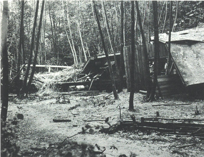
Aufnahme von der Unfallstelle in nördlicher Richtung.

men und weitergegeben worden. Überwachung und Einlagerung der Minen war Sache der jeweiligen Kompanie.