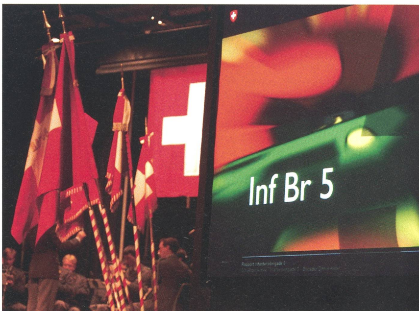
Zum Jahresrapport der Infanteriebrigade 5 kamen 650 Kader zusammen.

Dass man sich damit nicht immer nur Freunde schafft, liegt auf der Hand. Aber